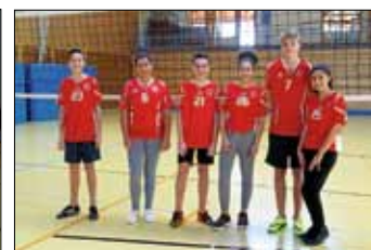
Team OSS II

Wir durften ein Schülerteam vom Albert-Einstein-Gymnasium Böblingen begrüßen. Die drei angetretenen Teams spielten in je zwei Spielen die Qualifizierung für das