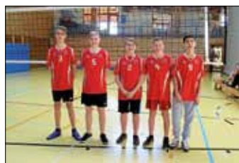
Team OSS I

Am Dienstag, den 06.12.2016, nahmen zwei Volleyballteams unserer Schule an dem Regionalentscheid Jugend trainiert für Olympia teil.