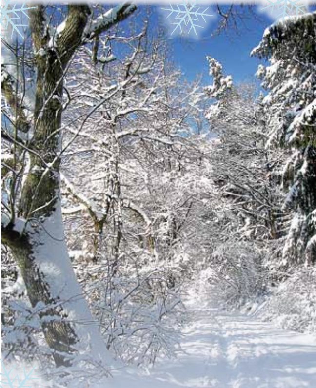
Winter im Schaichtal Dezember 2010