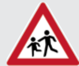
Fußgängerumleitung von der Weiler Straße über den Verbindungsweg (Kurze Straße) zwischen Wiesenstraße und Kirchstraße zur Schule