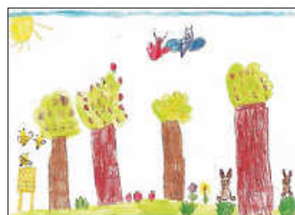
Tiere auf der Streuobstwiese

Der Verein Schwäbisches Streuobstparadies e.V. ruft zum Malwettbewerb am internationalen Kindertag am 1. Juni auf. Das Thema: Tiere auf der Streuobstwiese