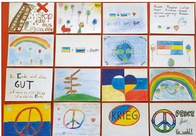
Foto: Schüler/-innen unserer 3. und 4. Klassen

Liebe Mitbürger in Dettenhausen, beim Bücherflohmarkt am 9.4.22 im Alten Schulhaus können Sie gegen eine Spende Friedenskarten von Schüler/-innen unserer 3. und 4. Klassen mitnehmen. Verschicken Sie Grüße oder nutzen diese Karten als Lesezeichen oder zum Aufhängen! Eine kleine Auswahl sehen Sie hier: