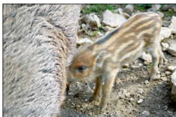
Wildschweine mit Nachwuchs können auch für Hunde und deren Halter:innen gefährlich werden.