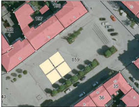
Die Schirme sollen im mittleren Markt-bereich angeordnet werden. Schaubild: Stadt Treuen

Ziel in den Arbeitsgruppen, die sich seit Sommer letzten Jahres regelmäßig trafen, war die Aufwertung und Attraktivitätssteigerung des Marktes durch Schaffung von neuen und witterungsunabhängigeren Aufenthaltsmöglichkeiten, um beispielsweise auch durch kleine Veranstaltungen und Abendmärkte die Einwohner, aber auch Gäste, in unsere Innenstadt zu holen.