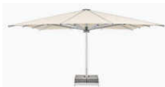
Ein Schirm hat einen Durchmesser von knapp 50 m².

„In unserem Projekt wird durch Ergänzung mit neuer Möblierung und Spielelementen die Aufenthaltsqualität verbessert und folglich die Verweildauer am Markt verlängert. Zusätzlich wird die Planungssicherheit für bestehende Festivitäten, wie Stadtpicknick, Hutzentag, Herbstfest, Maibaumaufzug und ähnliche Veranstaltungen erhöht. Die deutliche Reduzierung der Wetterabhängigkeit bietet die Grundlage für die Etablierung neuer Veranstaltungsformate, wie z.B. regelmäßig wiederkehrende Abendmärkte“, beschreibt Bürgermeisterin Andrea Jedzig die Vorzüge der geplanten Veränderung.