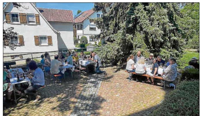
Endlich wieder in froher Runde!