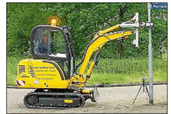
Straßenbeleuchtungsmasten der Standsicherheit von Prüfmobil

Zur Vermeidung möglicher Schäden, die durch nicht mehr standsichere Straßenbeleuchtungsmasten entstehen können und aufgrund der allgemeinen Verkehrssicherungspflicht sind die Kommunen zur regelmäßigen Überprüfung der Standsicherheit von Straßenbeleuchtungsmasten verpflichtet.