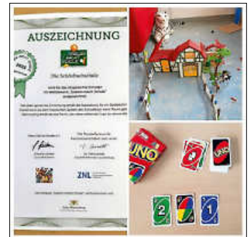
Plakat: Frau Urban

Die dritte Möglichkeit, wie die Kinder von den Spielen profitieren können ist die, dass ganze Klassen „zur Belohnung“ in einer Schulstunde zur Schulsozialarbeit kommen dürfen. Dies wird mit der Lehrkraft nach Bedarf vereinbart. Die eine Hälfte der Klasse wird unterrichtet, während die andere Hälfte zum Spielen geht. In der nächsten Schulstunde wird dann gewechselt. So können die Kinder in einer Schulstunde mit der halben Klasse intensiv lernen und in der anderen Schulstunde intensiv spielen. Für Kinder und Lehrkraft eine „Win-win“-Situation. Und der Gewinn für die Schulsozialarbeit ist, dass sie die Kinder besser kennenlernt, Vertrauen aufgebaut wird und das Schulsozialarbeiterzimmer bekannt wird. Dadurch nehmen die Kinder das Angebot der An-