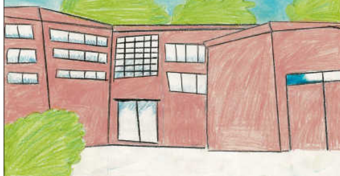
Plakat: Bühnenbild AG der OSS

Im Forum der Oskar-Schwenk-Schule Waldenbuch