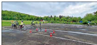
Fachlehrerin 4b

Herzlichen Glückwunsch zur bestandenen theoretischen und praktischen Radfahrprüfung! Wir wünschen euch unfallfreies Fahren im Straßenverkehr!