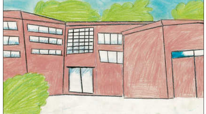
Plakat: Musical AG der OSS

Im Forum der Oskar-Schwenk-Schule Waldenbuch