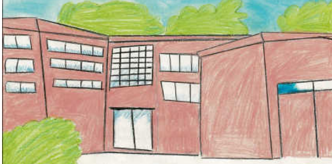
Plakat: Bühnenbild AG der OSS

Im Forum der Oskar-Schwenk-Schule Waldenbuch